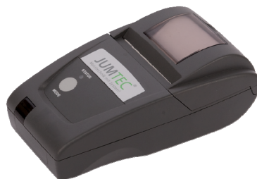
JUMTEC UD-200 Thermodrucker schnell IrDa und HP-IR Interface Bestell-Nr. 1090400