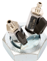
Einrohrprüfkappe DN25 Bestell-Nr. 6028832