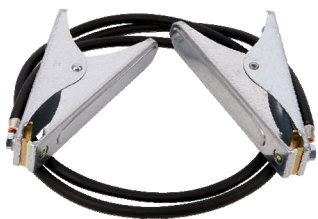
Überbrückungsgarnitur Bestell-Nr. 6028638