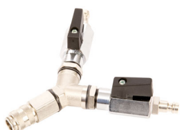
Y-Stück mit 2KH NW5 GAS Bestell-Nr. 7075202