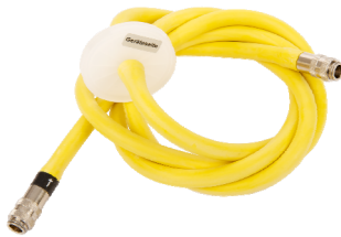
Ausgangsschlauch mit Filter Bestell-Nr. 5150456