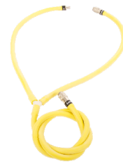
Y-Schlauch Bestell-Nr. 5150457