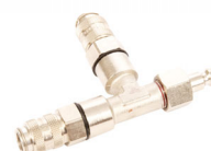
T-Stück NW 5 GAS Bestell-Nr. 1081005