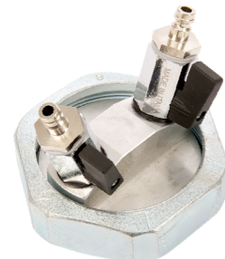
Einrohrprüfkappe DN40 Bestell-Nr. 6028835