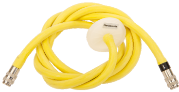
Eingangsschlauch mit Filter Bestell-Nr. 5150455