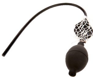
Doppelballpumpe Bestell-Nr. 7075220