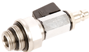
Prüfanschluß R1/2" + 3/4" Bestell-Nr. 6028843