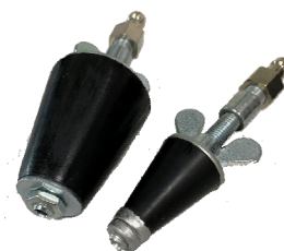
Prüfstopfen konisch mit Nippel NW5 12-22mm 7075101 19-32mm 7075102 24-44mm 7075103 35-65mm 7075104