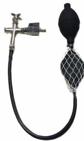
Pumpgarnitur komplett mit Y-Schlauch und Absperrventil Bestell-Nr. 5150459