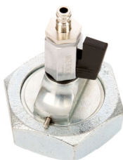
Einrohrprüfkappe DN25 1 KH Bestell-Nr. 6028830

R1" Nr. 6028849 R1.1/2" Nr. 6028845 R1.1/4" Nr. 6028846 R2" Nr. 6028850