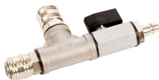
T-Stück NW 7.2 Druckluft Bestell-Nr. 6070430