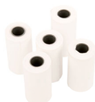
Thermopapierrollen 10 Jahre Langzeitstabil VE = 5 Rollen Bestell-Nr. 1090410